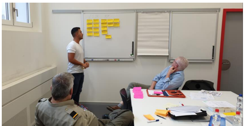
Abbildung 1: Identifikation und Vorstellung der Themenfelder pro Bereich

In der ersten Phase des Workshops fand ein Brainstorming durch die Teilnehmer statt. Jeder Teilnehmer notierte auf Post-it seine Gedanken zu den einzelnen Themenfelder. In der Folgephase wurden die Priorisierungen innerhalb der Themenfelder diskutiert und zugeteilt. Die Themen sollen nach Prioritäten bearbeitet und Lösungsvarianten als Entscheidungsgrundlagen erarbeitet werden. Ebenfalls wurde der Zeithorizont für die Bearbeitung der einzelnen Themen festgelegt.