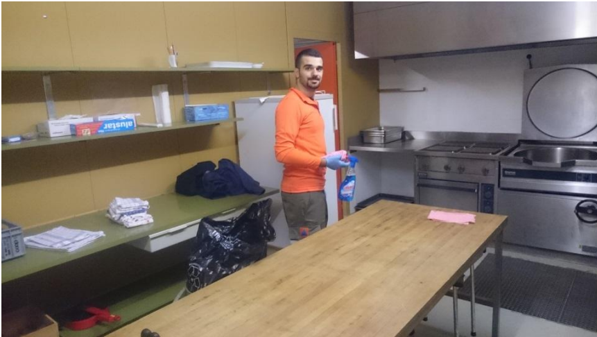
Abbildung 3: Zivilschutzanlage KPII / BSA II Neuendorf