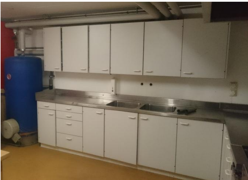
Abbildung 4: Küche Zivilschutzanlage Egerkingen

Alle geplanten Ziele konnten erfolgreich erreicht werden.