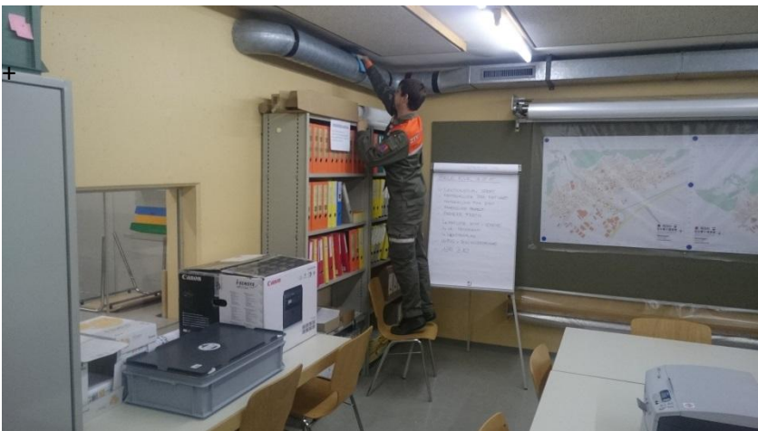
Abbildung 1: Zivilschutzanlage KPII / BSA I Gesch San Stelle Oensingen