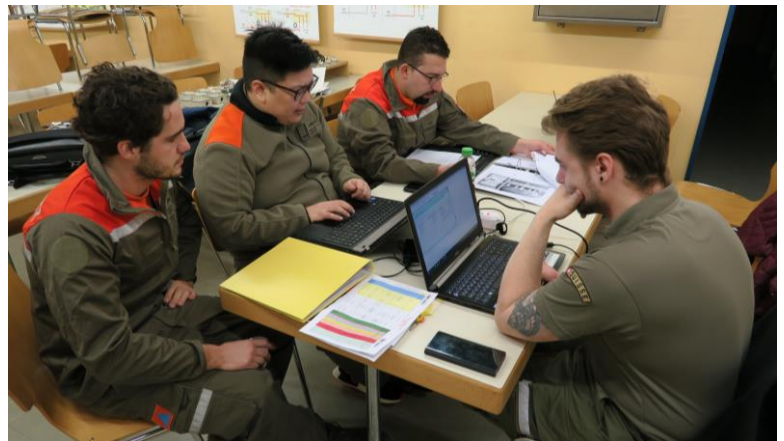
Abbildung 1: Die Zivilschützer bei den Planungsaktivitäten der PSK und Zupla

Vom Mittwoch, 14. März 2018 bis Freitag, 16. März 2018 trafen sich vier Zivilschützer in der ZSA Oensingen für die Planungsaktivitäten der anstehenden Wiederholungskurse (WK). Der erste WK findet vom Montag, 04. bis Freitag, 08. Juni 2018 statt und umfasst die periodische Schutzraumkontrolle mit der damit verbundenen Zuteilungsplanung. Als zweiter WK wird für den Zeitraum vom Mittwoch, 06. bis Freitag, 08. Juni 2018 ein Betreuer-WK geplant.