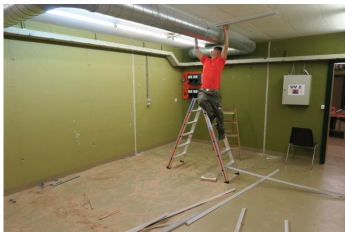
Abbildung 1: Allgemeine Rückbauarbeiten der Lüftung

Für den ersten Tag des Wiederholungskurses, am Mittwoch, 13. Juni 2018, rückten die neuen aufgebotenen Zivilschützer um 08.00 Uhr in der Zivilschutzanlage in Oberbuchsiten ein. Im Anschluss an die Begrüssung durch die Kursleitung wurden die Zivilschützer über die beiden Aufträge der nächsten drei Tage informiert. Die eingerückten Pioniere wurden in zwei Gruppen aufgeteilt. Die erste Gruppe war für den Anlagenrückbau in Oberbuchsiten verantwortlich. Die Gruppe zwei verschob nach Wolfwil und war zuständig für den Rückbau dieser Zivilschutzanlage.