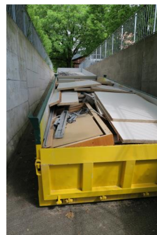
Abbildung 5: Material zur Entsorgung

Der Kursleiter Heinz Baumgartner bedankt sich bei allen Beteiligten Zivilschützern und dem eingesetzten Gewerbe für die einwandfreie, effiziente und unkomplizierte Zusammenarbeit.