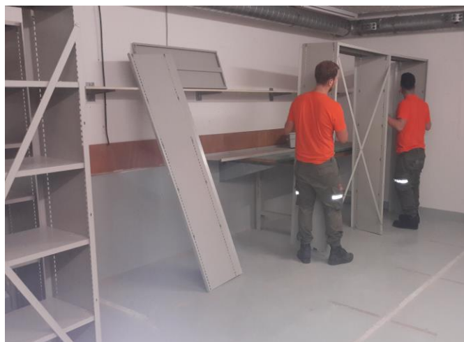
Abbildung 3: Allgemeine Rückbauarbeiten durch die Pioniere

In der Zivilschutzanlage Wolfwil wurden im Vergleich zu Oberbuchsiten die kompletten technischen Anlagen zurückgebaut. Dabei mussten z. B. die Sirenensteuerung aber auch die Notstromgruppe entfernt werden. Nebst den Sanitäranlagen wurden diverse Elektroinstallationen, komplette Infrastrukturen in den Büros und die Küche demontiert.