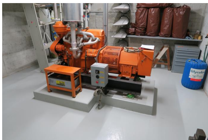
Abbildung 4: Diese Notstromgruppe wurde demontiert

Für den Ausbau des Öltanks musste die Betonwand gefräst werden. Die Zivilschutzanlage wird im Anschluss an die Abnahme des Rückbaus analog Oberbuchsiten in die Phase des Neubaus übergehen. In der Neubauphase wird die Anlage technisch modernisiert und steht im Anschluss dem Militär zur Nutzung zur Verfügung. Zudem besteht im Katastrophenfall die Möglichkeit für die rasche Umnutzung und den Betrieb von zusätzlichen Schutzplätzen für die Gemeinde Wolfwil.